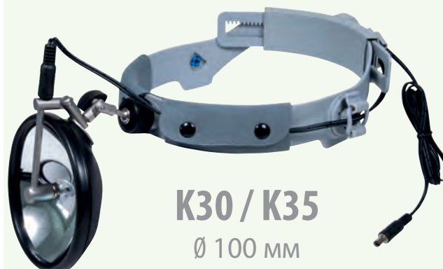
K30 / K35 Ø 100 мм