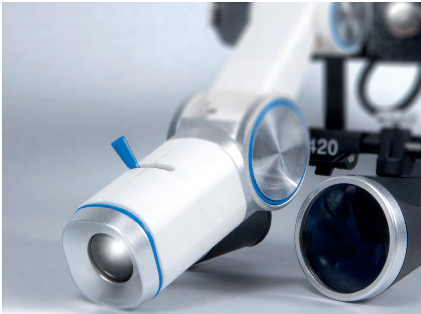
Фрагмент: аккумуляторная батарейка для головного обруча