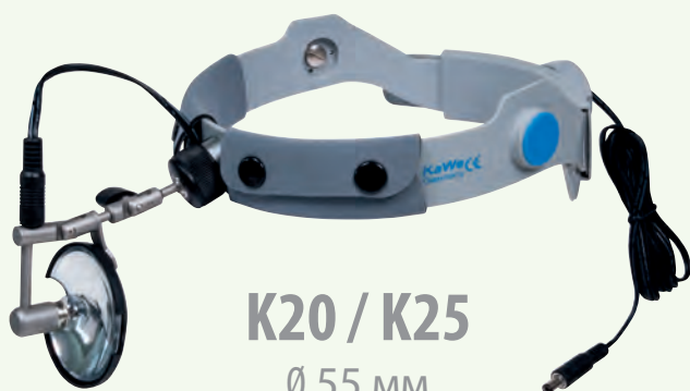
K20 / K25 Ø 55 мм